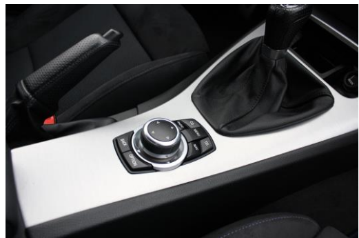
Details bspw. Bedienung