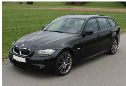
Schräg von vorne links