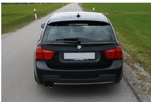
Heckansicht von hinten