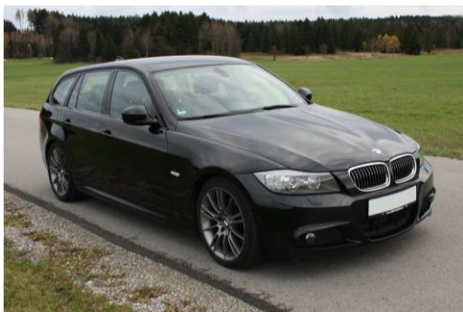
Schräg von vorne rechts