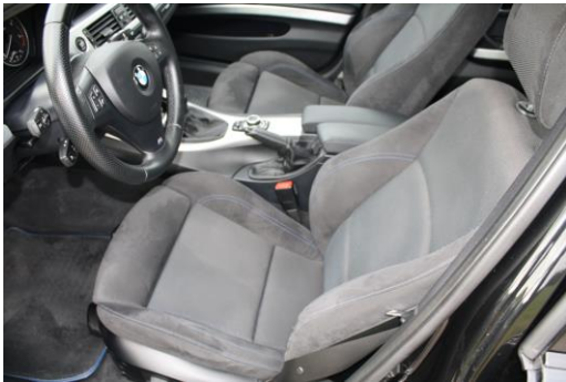
Interieur Sitze vorne links