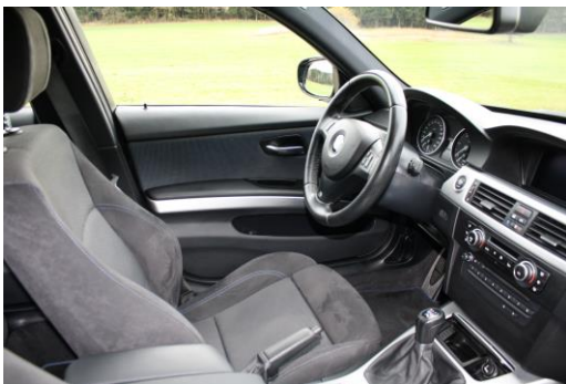
Interieur Fahrerplatz von rechts