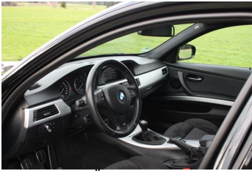
Interieur Übersicht von links