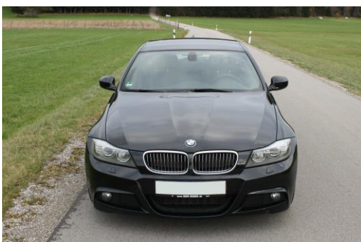
Frontansicht von vorne