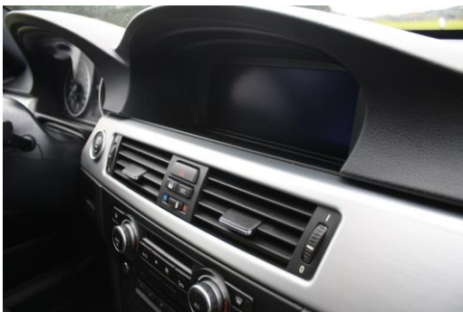
Details bspw. Navigationssystem