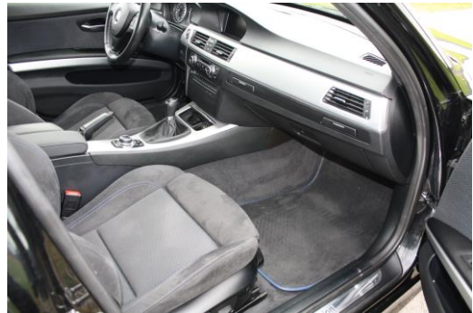
Interieur Sitze vorne rechts