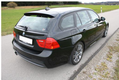
Schräg von hinten rechts