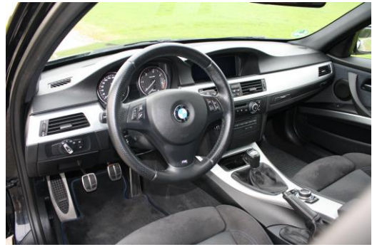
Interieur Detailansicht von schräg links