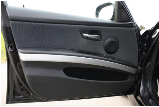
Details bspw. Türverkleidung