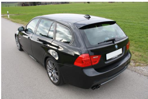
Schräg von hinten links